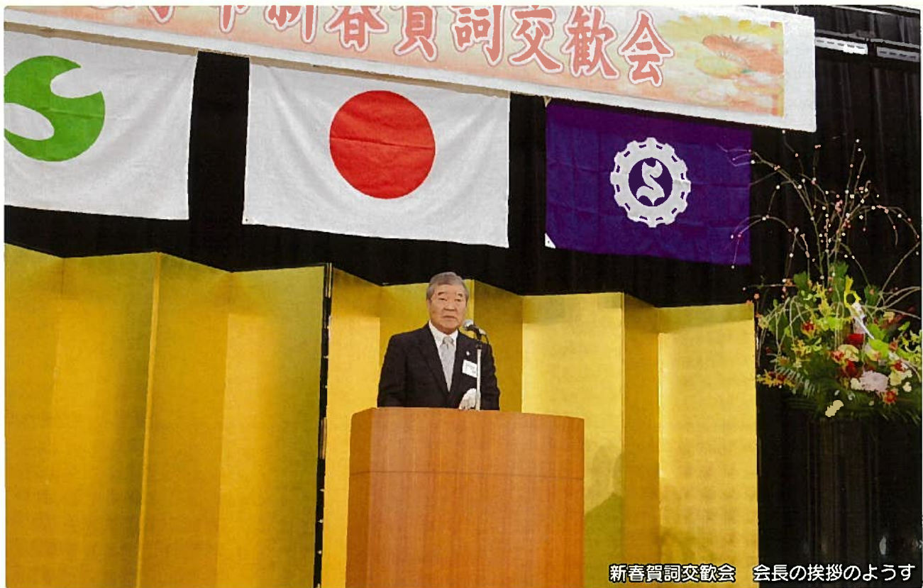
新春賀詞交歓会 会長の挨拶のようす