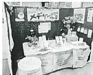
有限会社 ジョイフル 三重県志摩市志摩町和興1959-1 TEL:0599-85-6859