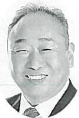
志摩市長 竹内 千尋