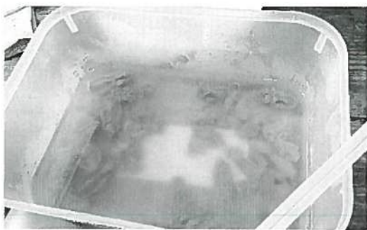
シーガルインにて試食したガンガゼウニ