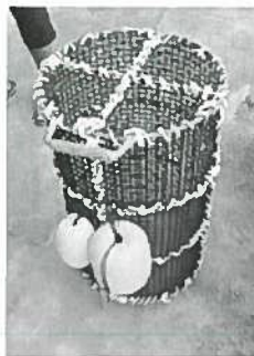
使用している道具

等現在主に流通しているウニと比べて風味は劣るものの十分商品化を検討できると感じました。また、志摩市のお土産店にはせんべい等ウニを加工した商品が並べられておりました。