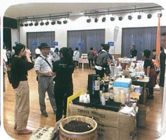
志摩のええもんまつり