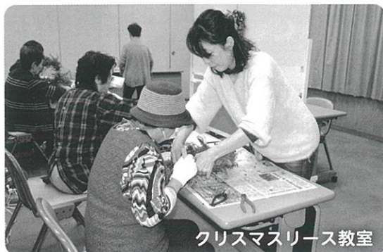
クリスマスリース教室

た時には達成感と作品の仕上がりには満足していただけたと思います。 生の木はそのままドライになっていくのでクリスマスまで楽しんで頂けると嬉しいです。 毎回教室では、私自身が勉強させて頂く場でもあります。今回も商工会の皆さんと教室が出来て楽しい時間が過ごせました。長い時間細かい作業をして頂きありがとうございます。