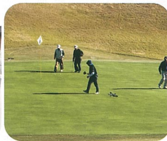
親睦ゴルフコンペ