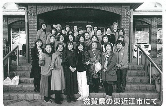
滋賀県の東近江市にて

教室のお話を頂き、何をしようかを一番悩むところで今回はリースがいいということに即決！ どうせ作るなら、しっかりと物にしたいと思い本格的に手の込んだものにしてみました。生の木を数種類使い、小さな束を沢山作る作業から始まり完成するまで2時間あまりびっしりとかかって仕上げて頂きました。同じ作業ばかりで、皆さん途中くじけそうになりながらも出来上がっ