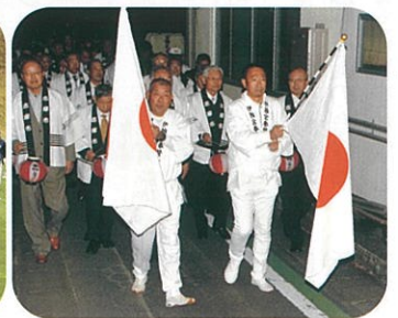
天皇即位奉祝提灯行列