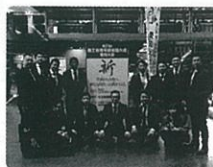
▲商工会青年部全国大会愛知大会

昨年8月28日に、軽減税率についての研修会を開催しました。消費増税に伴う軽減税率制度の概要を学び、複数税率に對応できる請求書の発行や、税率区分経理事を学びました。若手後継者として自社の事業に活用できる知識を得ることができ、経営力の向上を図ることができたと感じました。また、昨年12月4日、5日には第21回商工会青年部全国大会愛知大会に視察研修旅行として参加しました。大会期間中は、全国の青年部員の方々と日々の青年部活動の情報交換などを通じて交流することが出来ました。来年度も若手後継者として多くの学びの場となるよう取り組んでいきます。