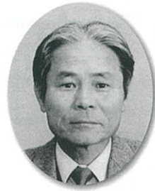
志摩市商工会 会長