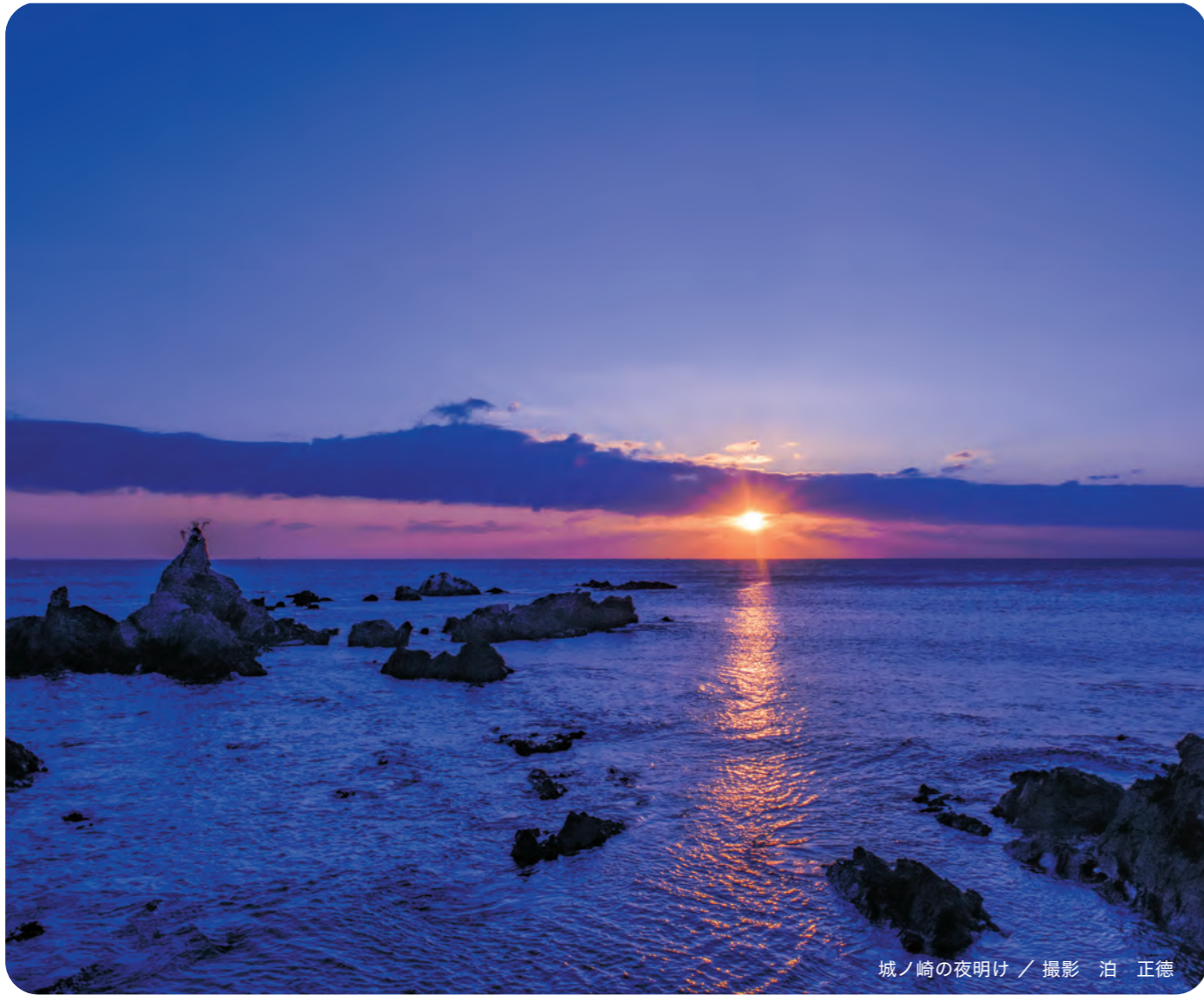
城ノ崎の夜明け