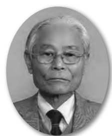
志摩市商工会会長