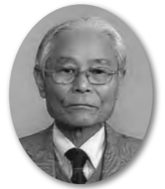
志摩市商工会会長