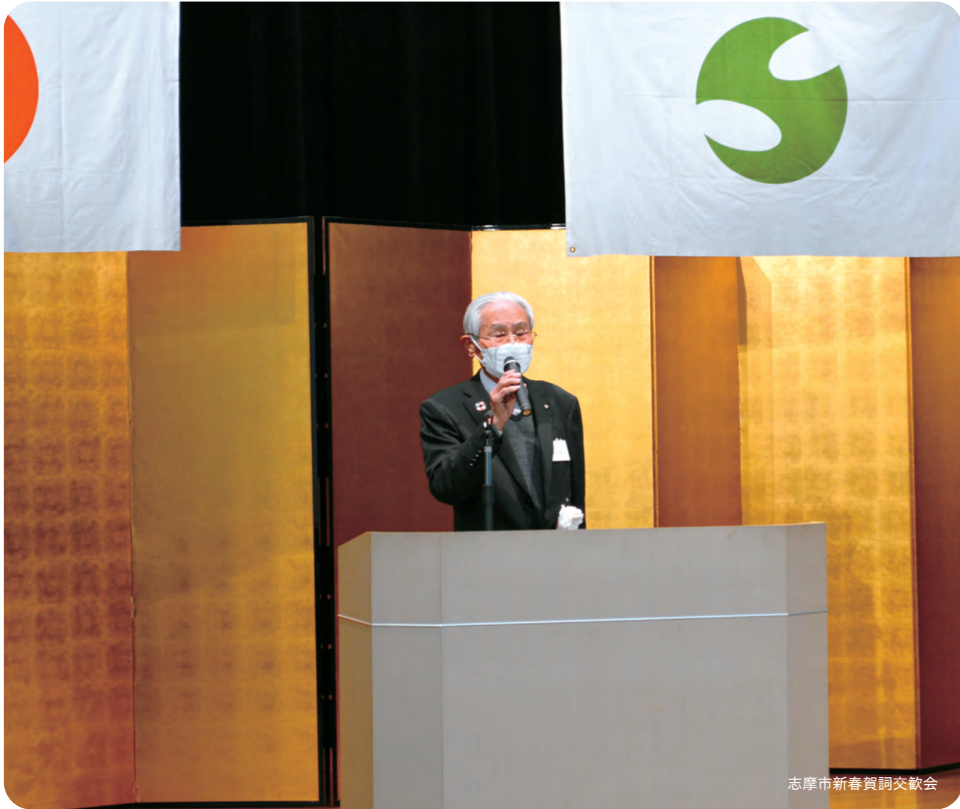
志摩市新春賀詞交歓会