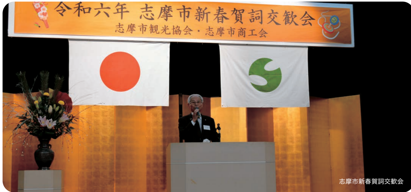
志摩市新春賀詞交歓会