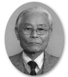
志摩市商工会会長